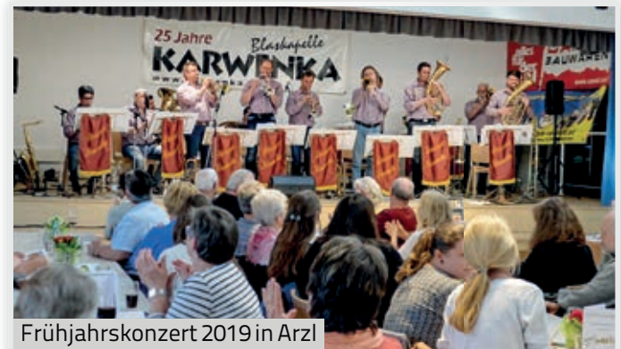
Frühjahrskonzert 2019 in Arzl

Ein besonders gelungenes Gemeinschaftsprojekt fand am 17. März 2019 an einem wunderbaren Sonntagmorgen statt. Gemeinsam mit der Stadtmusikkapelle Innsbruck-Arzl durfte die Blaskapelle KARWENKA im frisch renovierten Saal im Vereinsheim ihr 26. Frühjahrskonzert veranstalten. Die durch die Umbauten wesentlich verbesserte Akustik im Saal hat sowohl Musiker als auch das sehr zahlreich erschienene Publikum schlichtweg begeistert.