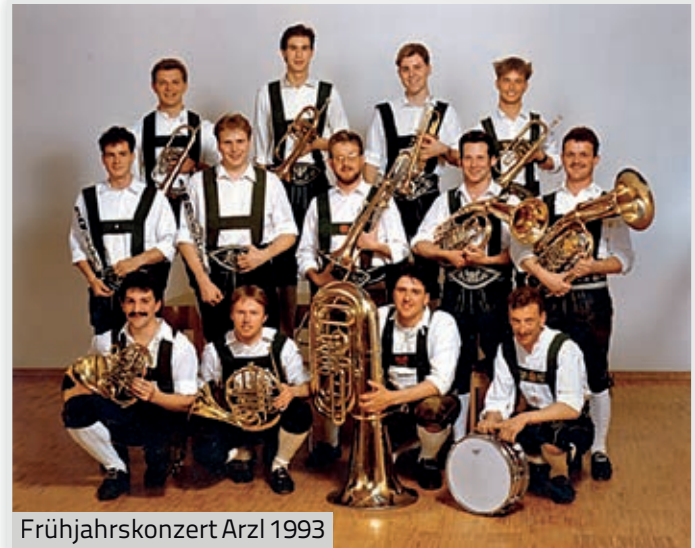
Frühjahrskonzert Arzl 1993

Neben feurigen Polkas, imposanten Märschen und wunderbaren Walzermelodien umfasst das Repertoire der 13 Tiroler Vollblutmusikanten auch moderne Arrangements von Jazz-, Pop- und Rock-Klassikern und Gesangseinlagen.