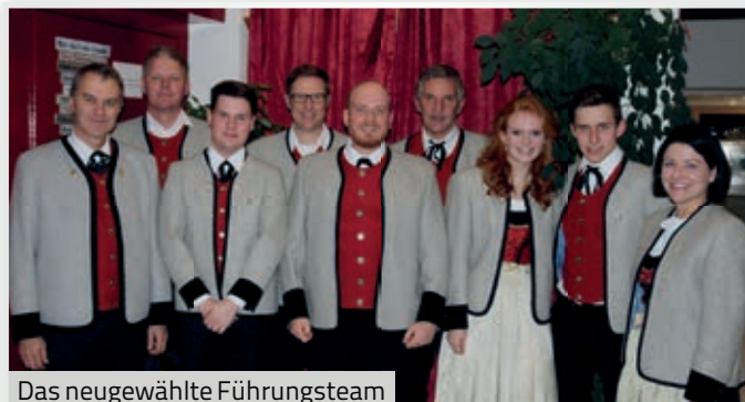
Das neugewählte Führungsteam